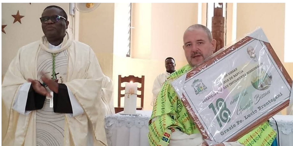
Festa di saluto nella parrocchia di Bafatá