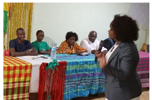
Momento assembleare dell'Associazione