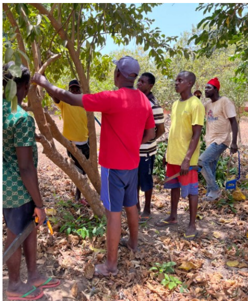
Partecipanti alle attività del Centro di Nhabidjon