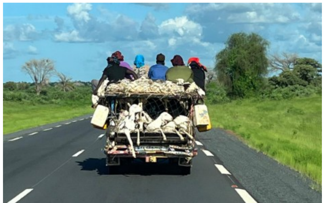
Immagini di vita

Abbiamo incontrato anche l'associazione "Insieme per l'Africa" di Ceggia (VE) e il Gruppo Missionario Bedanda ETS di Jesolo (VE).