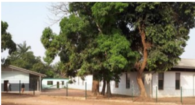
Scuola di Sambu