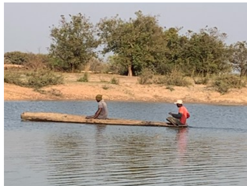
Immagini di vita