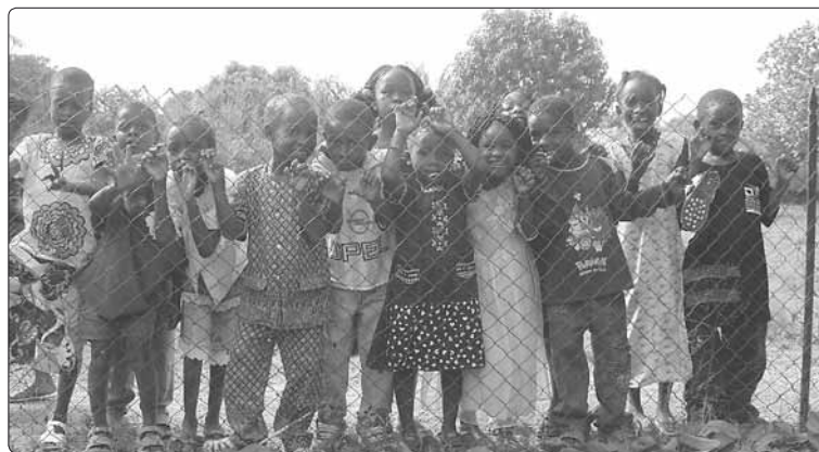
Il presidente e il direttivo della Rete Guinea Bissau onlus, insieme ai bimbi della Guinea Bissau, augurano a tutti i soci, amici e simpatizzanti e loro famiglie un Sereno Natale e un Felice 2010!!!

Facciamo insieme una catena di solidarietà per gli amici di Guinea Bissau.